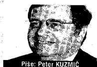
Piše: Peter KUZMIĆ

Prava bolesnika nadasve su i eminentno ljudska prava pa je stoga etički imperativ ljudske zajednice općenito, a medicine posebice da svakoj osobi omogući da optimalno živi i dostojanstveno umre