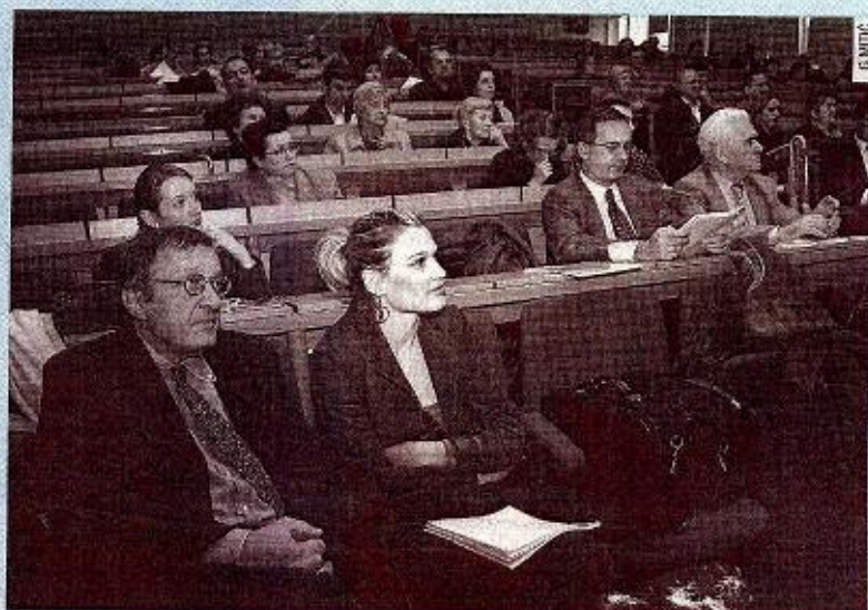
Predavanje francuskih i belgijskih stručnjaka na Ekonomskom fakultetu - prof. dr. Charles-Henri Rapin (prvi slijeva)

OSIJEK - Pred Osječko-baranjskom županijom i gradom Osijekom u idućim mjesecima je velik izazov. Pitanje je hoće li se prionuti detaljnoj razradi ideje, a posebice financijskog plana za osnivanje hospicija, zdravstvene ustanove u kojoj se na najsuvremeniji način brinu za zdravlje i negu starih, nemoćnih i bolesnih osoba, ali prema najsuvremenijim standardima. Već nekoliko godina Udruga prijatelja hospicija i dr. Mira Fingler iz Kliničke bolnice Osijek, zastupaju ideju da se u sveobuhvatnoj borbi protiv boli u Osijeku osnuje takva zdravstvena ustanova koja bi rastezila bolničke kapacitete i az znatno manja sredstva pružila valjanu negu i liječenje starima i nemoćnima. Osijek je itoga, na Veliki četvrtak, bio lomačin najuglednijim stručnjacima s tog područja - prof.dr. Charlesu-Henriju Rapinu, zamjeniku Interuniverzitetskog centra za gerontologiju i Zenevi i predsjedniku Međunarodnog udruženja "Zajedno protiv boli" i dr. Bernardu Waryju, prestojniku Regionalnog bolničkog centra za palijativnu skrb i savjetovališta za ol u Metz-Thionvillu, u Francuskoj. Mnogo je još stručnih ankija koje obavljaju Wary i